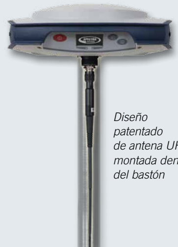
Diseño patentado de antena UHF montada dentro del bastón